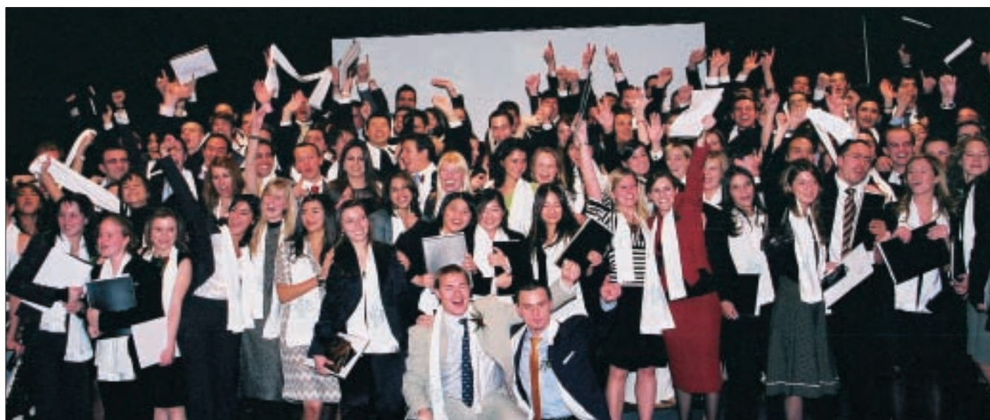
Trois cérémonies de promotions ont marqué la fin du semestre Automne 2006 de l'EHL.