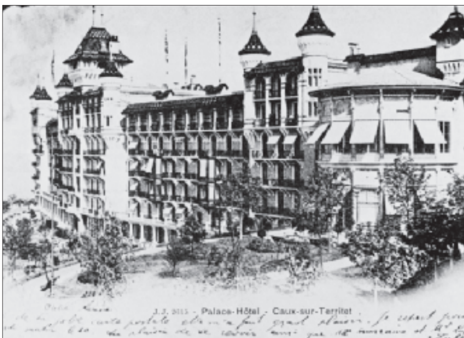
Le Palace-Hôtel de Caux, au-dessus de Montreux, à la fin du XIX e siècle.