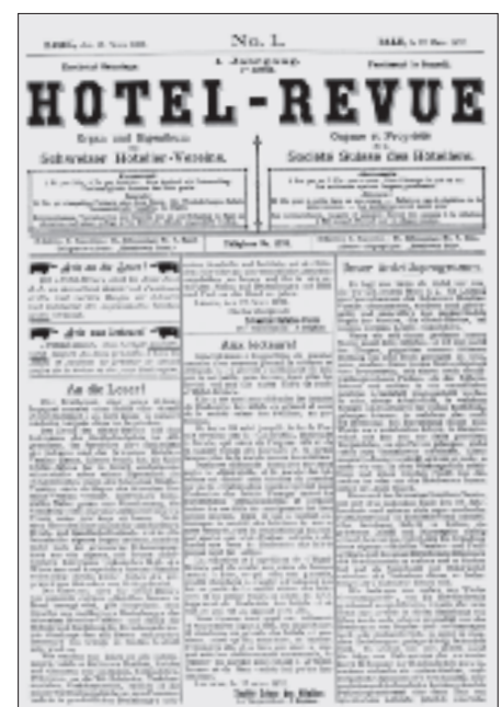
La «une» du premier numéro de l'Hôtel-Revue, le samedi 12 mars 1892.