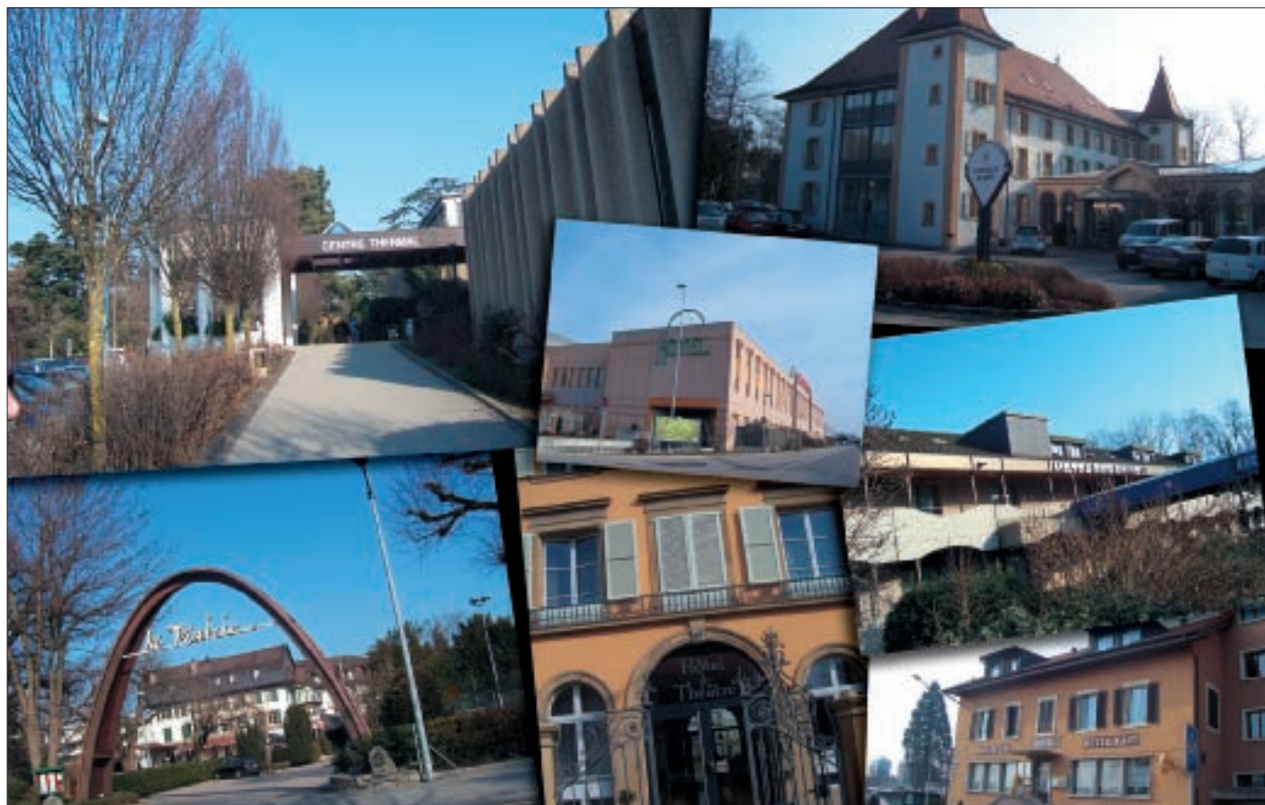
Le Centre thermal et les six hôtels membres d'hotelleriesuisse et d'Hôtellerie Vaudoise: Grand-Hôtel des Bains, La Prairie, Hôtel du Théâtre, Motel des Bains, Expo Hôtel et Hôtel du Lac.

L'OTV, dans un récent communiqué de presse, met à bon escient en exergue la réputation du Pays de Vaud, «l'une des régions les plus réputées, à l'échelle mondiale, pour les arts de la table». En nul autre endroit, on ne trouve une telle densité de restaurants prestigieux, étoilés par le guide Michelin ou toqués par le Guide GaultMillau. Les guides 2007 précités le confirment: dans le seul canton de Vaud, 81 établissements cumulent respectivement 22 étoiles et 1123 points. Ce qui est de bon augure si l'on sait que les plaisirs de la table figurent parmi les cinq motivations de séjour les plus souvent citées par nos hôtes... Les guides plus régionaux (Le Coup de fourchette, La Suisse gourmande, etc.) mentionnent également de nombreux restaurants et auberges fleurant bon l'authenticité, le charme et la qualité de l'accueil, si recherchés par les touristes.