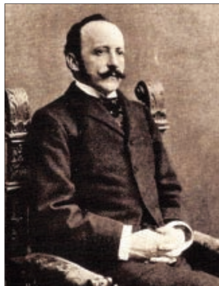
▼ César Ritz